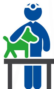
Станция по борьбе с болезнями животных (СББЖ)